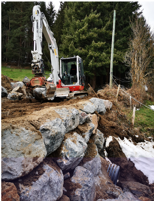
Travaux à la grange du bois

Les services techniques de notre commune réalisent des chantiers divers tout au long de l'année. Ils ont récemment effectués des travaux importants au cimetière, au rond roint des Mâts, à la piscine, à la grange du bois ou encore au chemin du cerisier. Voici des exemples de réalisations récentes.