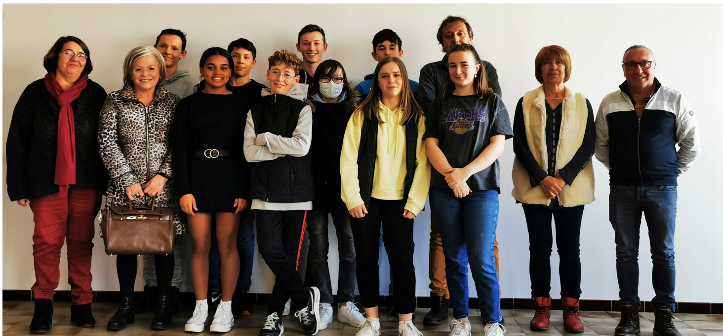
Le conseil municipal des jeunes, en mairie, le 8 avril